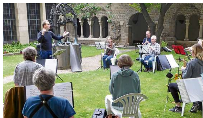
Beim Johannes-Fest wird es richtig musikalisch. Auch die neue Bläusersymphonie der Abtei hat fleißig geübt und zeigt ihr Können.

Für die Besucher öffnen die Prämonstratenser Kapitelsaal und Klostergarten, Foyer, die neue Kapelle und das Refektorium. Als weitere Attraktionen geplant sind Foto-Infos des Musikkollegs. Denn Lust auf Musik – auch zum Mitmachen – ist in der Pfarrei gewachsen.