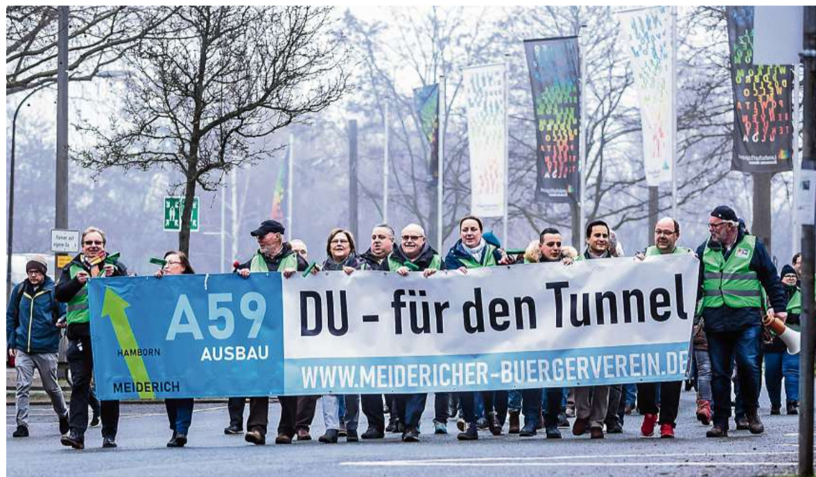
Der Meidericher Bürgerverein, hier im Januar 2020, lehnt den A-59-Ausbau in Hochlage weiterhin ab. Dieser Kampf könnte durch den künftigen Begleitausschuss der Stadt Duisburg schlagkräftiger werden.

Das größte Ärgernis für den Bürgerverein bleibt allerdings der geplante Ausbau der Autobahn 59. Die Verkehrsministerien von Bund und Land haben sich bekanntermaßen längst für eine Hochtrasse entschieden. Dahmen gibt die unterirdische Lösung allerdings nicht auf. Zumal noch nicht einmal das Planfeststellungsverfahren begonnen hat, nach dessen Ende die Ausbaupläne erst rechtsverbindlich werden.